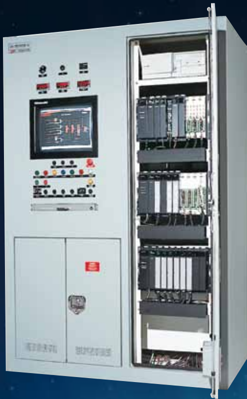
..... Tableau de commande intégré DI-TRONICS® IV pour turbine et compresseur.